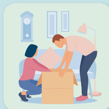
パートナーの転勤 による引っ越し