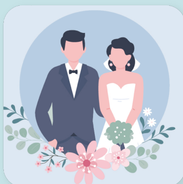
結婚 による引っ越し