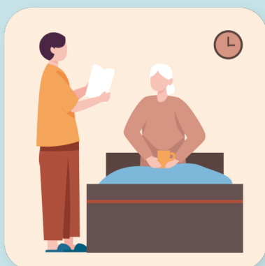
親の介護 による引っ越し

※採用は、各信用組合の採用基準に基づき行われることとなりますので、必ず再就職できるとは限りませんのでご注意ください。